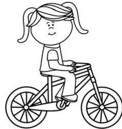
Au vodo tiko.