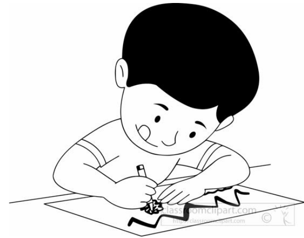
Au droini tiko.