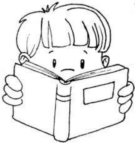
Au wiliwila tiko.