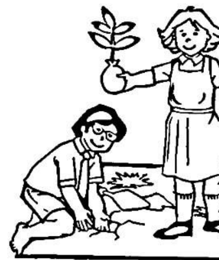
Au teitei tiko.