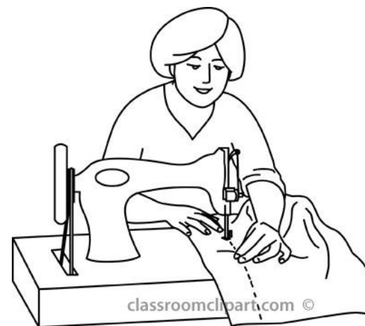
Au culacula tiko.