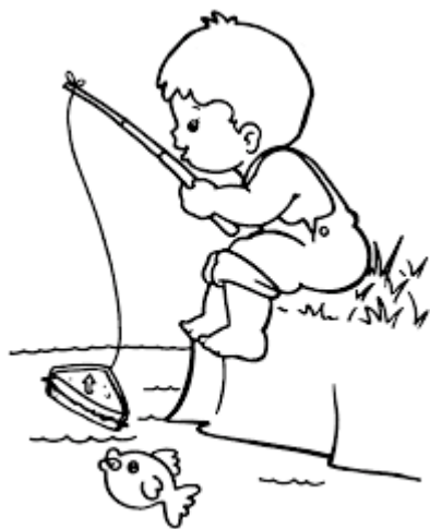
Au siwa tiko.