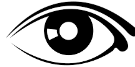
Oqo na mataqu.