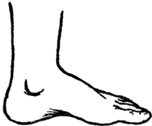
Oqo na yavaqu.