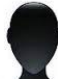
Oqo na uluqu.