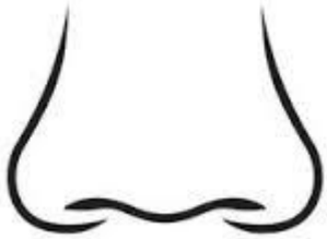
Oqo na ucuqu.