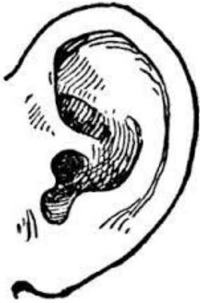
Oqo na daligaqu.