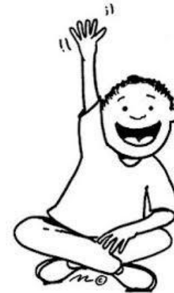
Oqo o yau.